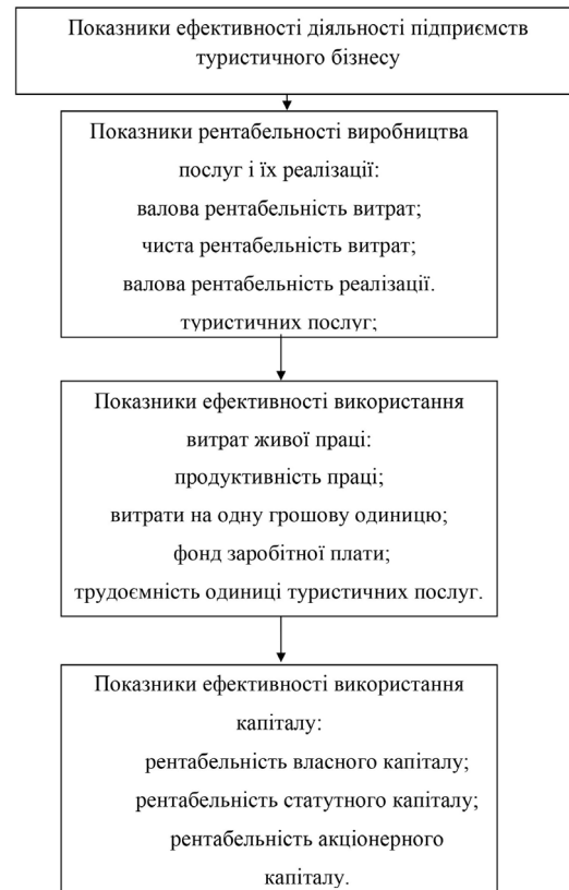
Рис. 2 Система показників ефективності діяльності підприємств туристичного бізнесу