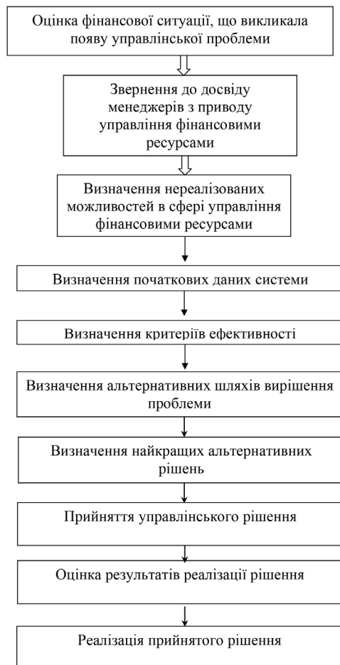
Рис. 1. Система управління фінансовими ресурсами туристичних підприємств