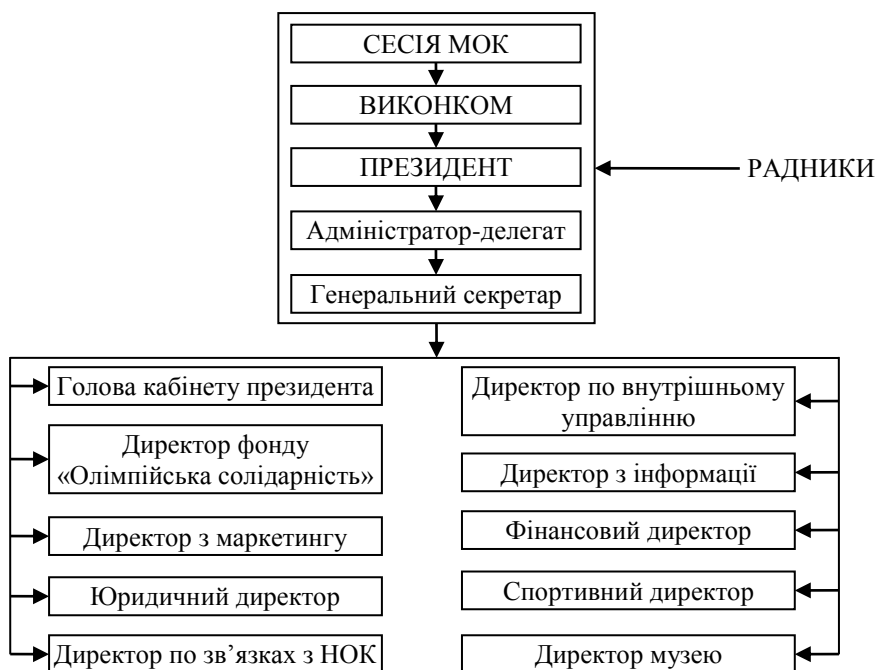
Рисунок 6.2. - Структура керівних органів МОК.

Цифрова революція. Сьогоднішнє світове суспільство є суспільством невідкладного спілкування. Прогрес в сфері комунікаційних технологій сповістив про початок нової цифрової епохи, яка докорінно змінила обмін та розповсюдження інформації та продовжує перетворювати наше суспільства в глобальну мережу. Олімпійський рух та його члени повинні повною мірою усвідомлювати вплив такого розвитку на всю їх діяльність. Майбутні стратегії і підходи потрібно планувати згідно з величезними новими можливостями та змінами, зумовленими цифровою революцією.