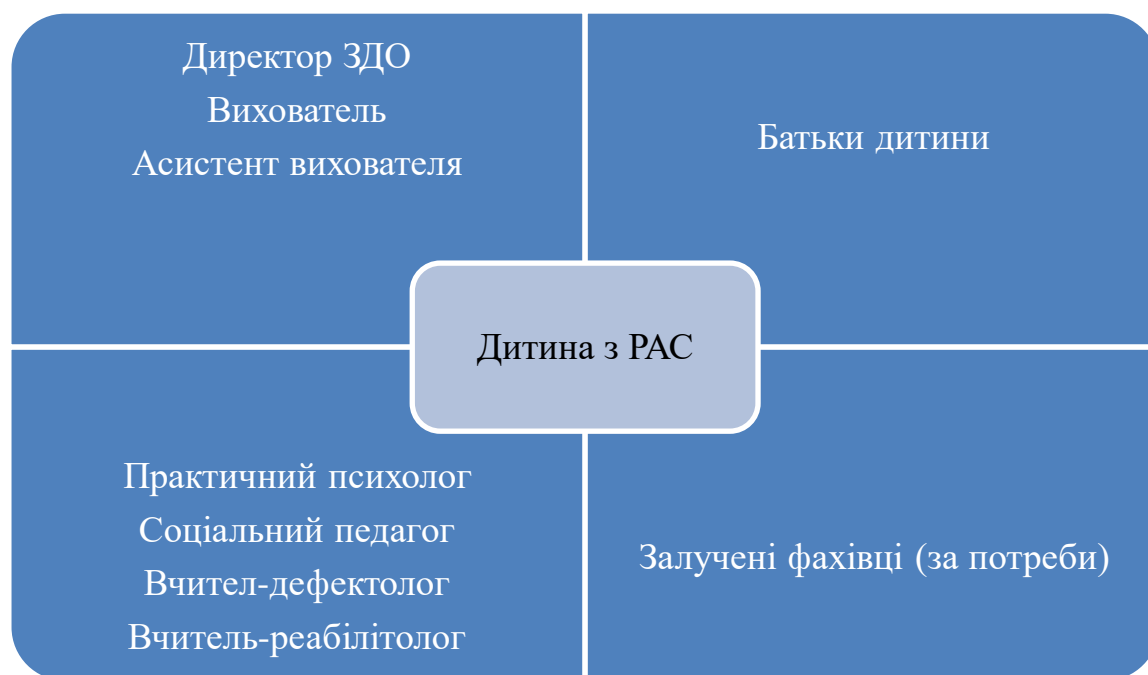
Мал.6. Модель Команди психолого-педагогічного супроводу дитини з РАС в ЗДО

В закладі дошкільної освіти для дитини з розладами аутистичного спектра до складу Команди супроводу входять: