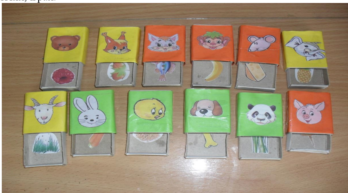
Мал.3. Дидактичні матеріали для роботи з дитиною з ООП

4. Використовуйте наочні стимули (картинки, малюнки) в розвивальних заняттях, іграх.