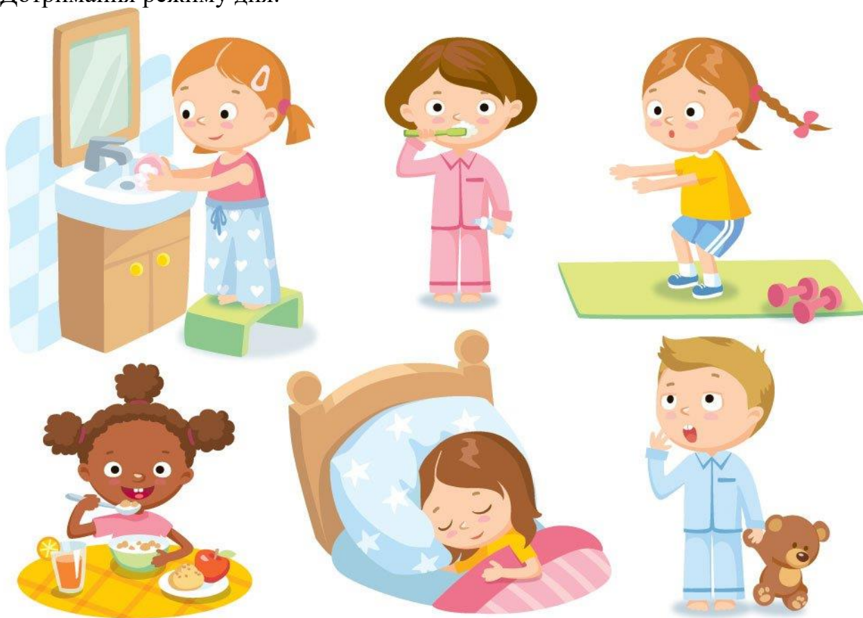
Мал.1. Режим дня