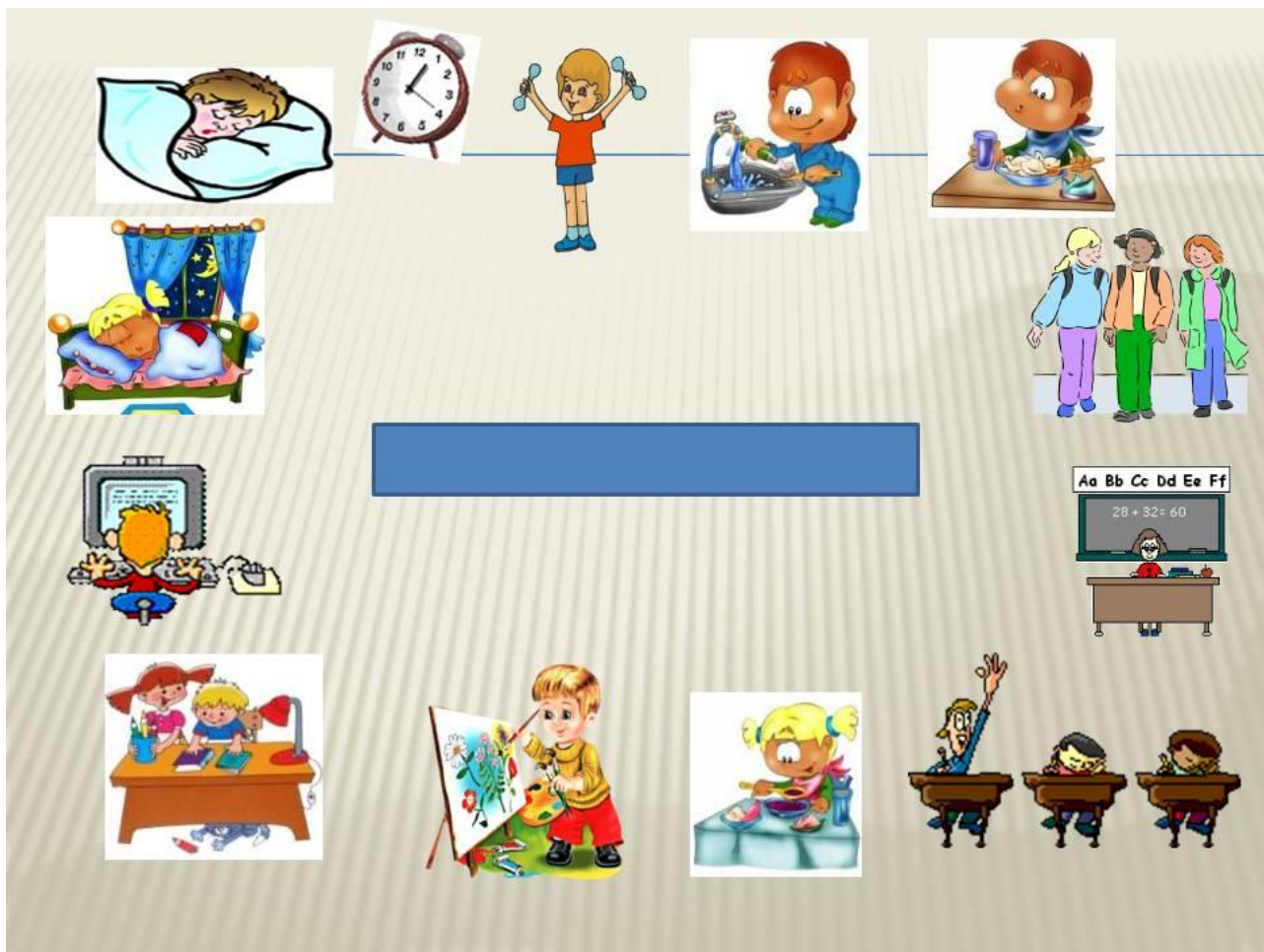
Мал. 2. Картки інструкції щодо організації розпорядку дня дитини з РАС

4. Використовуйте наочні стимули (картинки, малюнки) в розвивальних заняттях, іграх.