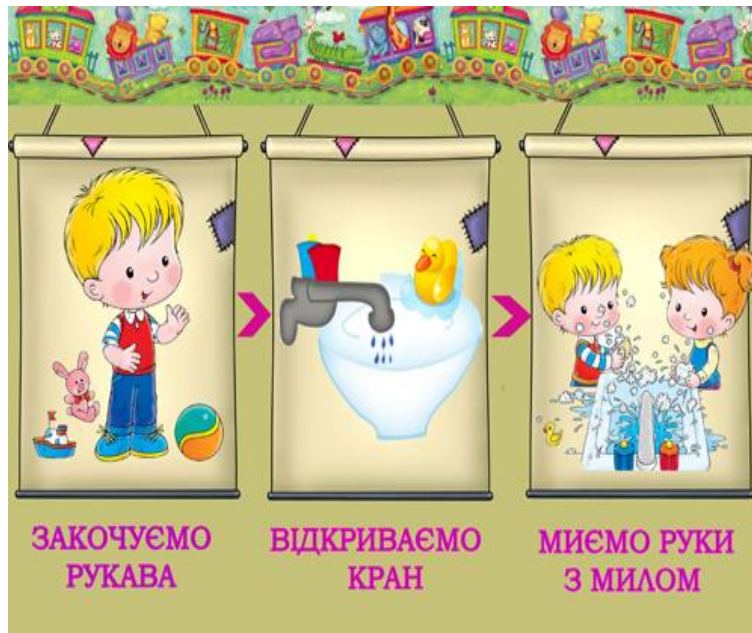
Мал.5. Правила миття рук

правила поведінки. Для початку це можуть бути правила такі, як: миття рук, самостійне приймання їжі та користування столовим приладдям, одягання-роздягання, вміння зав'язати шнурки на своєму взутті, готувати домашні завдання тощо.