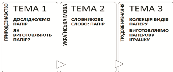
Рис. 1. Горизонтальні міжпредметні зв'язки

вивчення одного поняття на уроках з різних предметів протягом деякого часу (не одночасно)