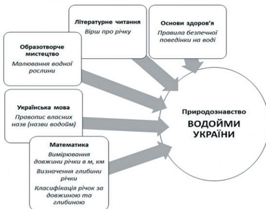
Рис. 2. Вертикальні міжпредметні зв'язки