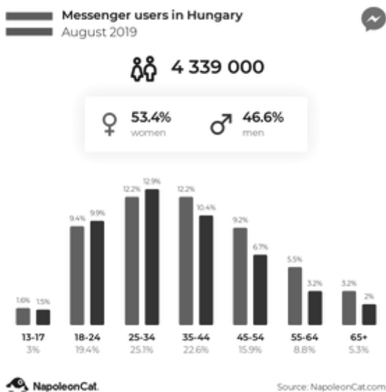
Рис. 2. Дані про користувачів Messenger у 2019 році в Угорщині

Messenger також дуже популярний в Угорщині, з точки зору маркетингу соціальних медіа. На цій платформі охоплюються користувачі, які відсутні у маркетингу на Facebook.