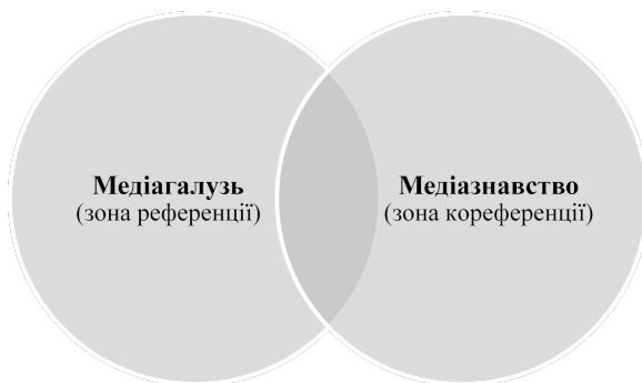
Рис. 1. Моделювання предметної сфери «медіазнавство» за параметром «зони сусідства»

медіабібліотека, медіабізнес, медіабрендинг, медіавиробництво, медіавірус, медіавласність, медіавплив, медіагігант, медіаграмотність, медіадизайн, медіадипломатія, медіадискурс, медіадіяльність, медіа-договір, медіаекран, медіаенциклопедія, медіаефект, медіажанр, медіа-журналістика, медіазалежність, медіазаконодавство, медіазапит, медіазасіб, медіаімідж, медіаімперія, медіаіндустрія, медіаінсталювання, медіаінструмент, медіаінтеграція, медіаісторія, медіаканал, медіа-категорія, медіакваліфікація, медіакит, медіакомпанія, медіакомпетентність, медіакомунікація, медіаконвергенція, медіаконсалтинг, медіаконтекст, медіаконтент, медіаконцепт, медіаконцерн, медіа-корпорація, медіакритика, медіаландшафт, медіаманіпуляція, медіа-маркетинг, медіамаркер, медіамедицина, медіакомісійні, медіаопції, медіаменеджмент, медіаметрія, медіамистецтво, медіамікс, медіамовлення, медіамоделювання, медіа модель, медіаносій, медіаоб'єкт, медіа-образ, медіаорганізація, медіаосвіта, медіаперформанс, медіанідприємство, медіанідтримка, медіаплан, медіапланування, медіаплатформа, медіаповідомлення, медіаподія, медіапокриття, медіаполітика, медіа-послуга, медіапрактика, медіапродукт, медіапроект, медіапростір, медіапросьюмеризм, медіапрофспілка, медіапроцес, медіареалії, медіареальність, медіареволюція, медіаредагування, медіареклама, медіаресурс, медіарилейшнз, медіаринок, медіарішення, медіасервіс, медіасередовище, медіасистема, медіаскульптура, медіасфера, медіаспоживання, медіа-