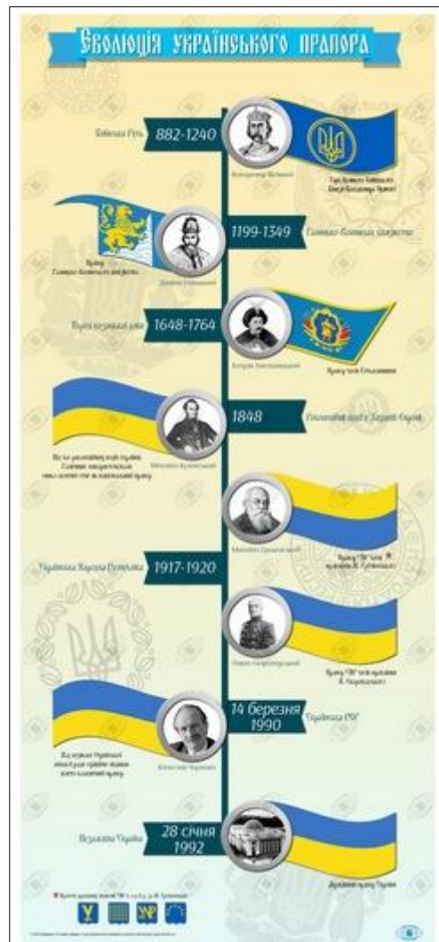
Рис. А.1. Інфографіка «Еволюція українського прапора», опублікована на сайті інформаційного агентства «УКРІНФОРМ» 14.08.2015 р.