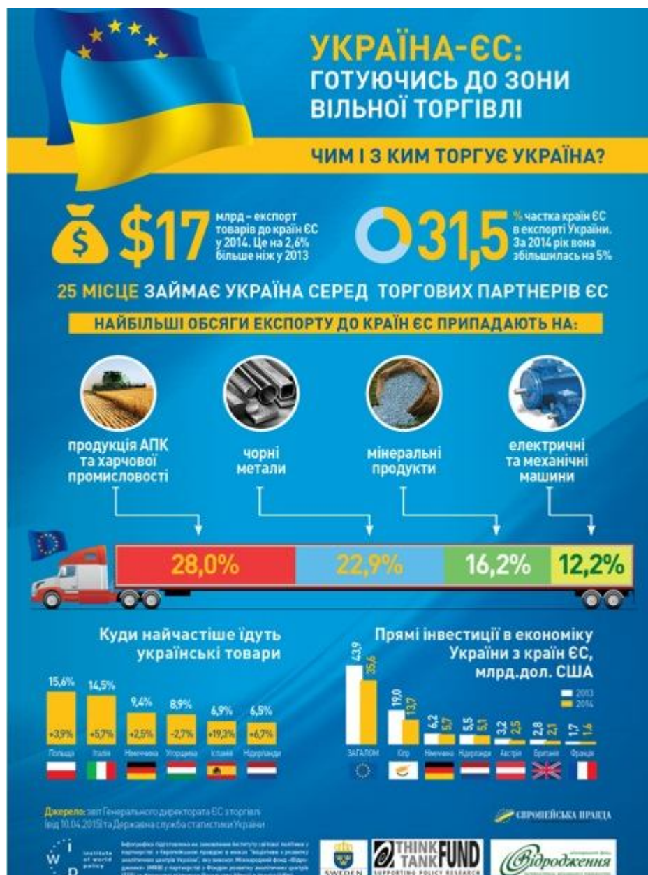
Рис. А.2. Інфографіка «Україна-ЄС: готуючись до зони вільної торгівлі», опублікована на сайті «Institute of World Policy» (iwp.org.ua) 28.06.2015 р.