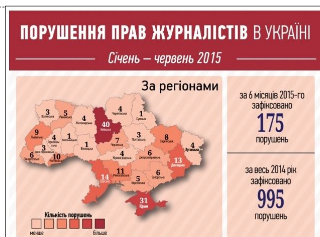
Рис. 2.1. Інфографіка на сайті інформаційного агентства УНІАН (матеріал за 03.07.2015 р.).

Основними ілюстраціями в курсовій роботі з ІЖ слугуватимуть зображення веб-сторінок – цілі скріншоти 4 або їх частини. Якщо ілюстрація займає менше, ніж півсторінки , її можна подати в тексті (без обверстування) безпосередньо після того місця, де про неї згадано . Для цього треба зробити один відступ, далі з нового рядка подати зображення, а нижче – підпис за таким зразком: