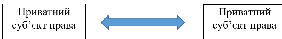
Мал. 1. Схема цивільно-правових відносин

Однак існують і змістові та сутнісні відмінності: