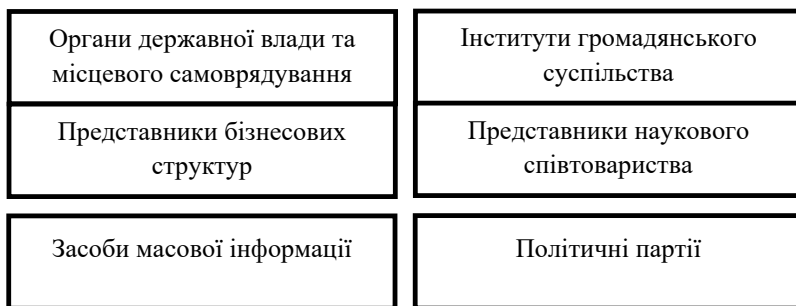
Рис. 6.1. Суб'єкти публічної політики

Громадянське суспільство як правове демократичне суспільство, у якому визначальним фактором виступають визнання, забезпечення та захист природних і набутих прав людини й громадянина, слугує соціальним джерелом побудови правової держави, передбачає публічність політичної діяльності та є одним із базових суб'єктів публічної політики (рис. 6.1).