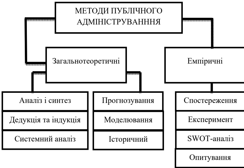
Рис. 1.1. Класифікація методів публічного адміністрування за видами наукового дослідження

Безумовно, здійснення процесу наукового пізнання, що спирається на об'єктивні дані, неможливе за умов невикористання методів дослідження. Загальновідомо, що загалом методи поділяються на загальнотеоретичні та емпіричні. Зокрема, на рис. 1.1 подано класифікацію методів публічного адміністрування за видами наукового дослідження.