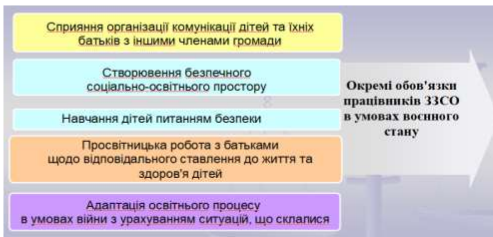
Рис. 2. Окремі обов'язки педагогічних працівників ЗЗСО в умовах воєнного стану

В умовах воєнного стану та надзвичайних ситуацій можна виокремити нагальні обов'язки педагогічних працівників ЗЗСО (рис. 2).