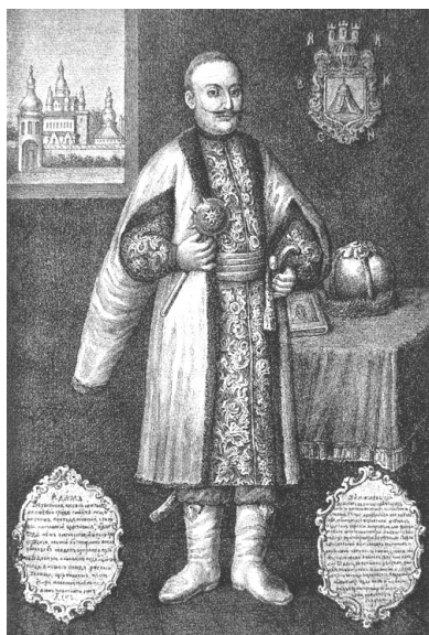
Адам Кисіль (1583-1645)

У європейській практиці модифікації політичного устрою та функціонування інститутів влади здійснювалися