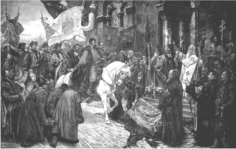
В'їзд Богдана Хмельницького до Києва

та вигуками як Мойсея, збавителя, спасителя, визволителя народу від польського гніту, щасливо іменованого Богданом, тобто Богом даним» 149 . Оцінка Богдана Хмельницького як «визволителя» зазначена і в нотатках московського посла Григорія Унковського на підставі його розмов з учасниками дійства, які заявляли: «Господь Бог дав нам нині християнської віри оборонця і від проклятої віри визволителя гетьмана Богдана Хмельницького» 150 .