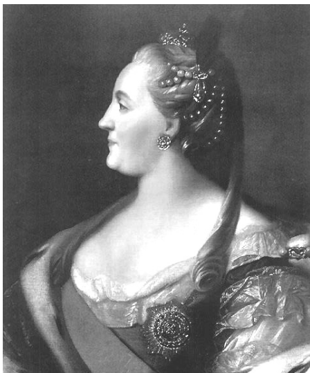
Катерина II (1729-1796)

через суперечності з царськими фаворитами, був змушений залишити Петербург і виїхати в Україну. Під впливом козацької старшини на раді в Глухові 1763 р. була сформульована чолобитна на ім'я імператриці під назвою «Прошение малороссийского шляхетства и старшин, вместе с гетманом, о возстановлении разных старинных прав Малороссии» 268 . В ній було