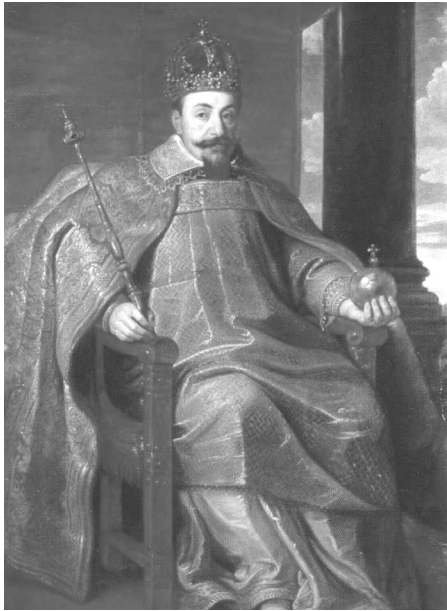
Сигізмунд III (1566-1632)

своєчасно притягати до суду «свавільних людей». Згідно з королівським універсалом від 25 липня 1590 р. на службу приймався тисячний козацький загін з оплатою від 5 до 12 злотих за квартал кожному козаку. Місцем постійного перебування реєстрових визначалося Запорозжя 70 .