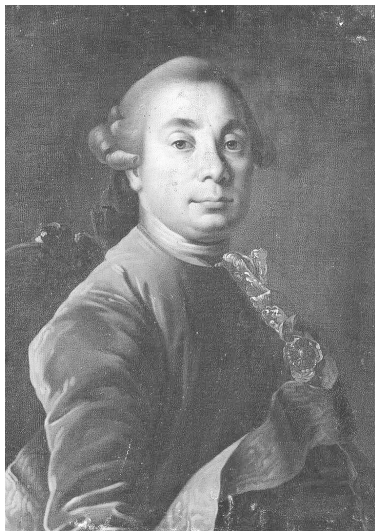
Григорій Теплов (1717-1779)

викладено погляд української еліти на майбутнє Гетьманщини, що продемонструвало рівень її політико-правової культури. Зокрема, наголошувалося на традиції поновлення і підтвердження договірних статей з посіданням царського чи гетьманського уряду новим правителем, що була порушена за гетьмана Івана Скоропадського. Пропонувалося встановлення української системи судочинства, очолюваною вищою апеляційною установою —