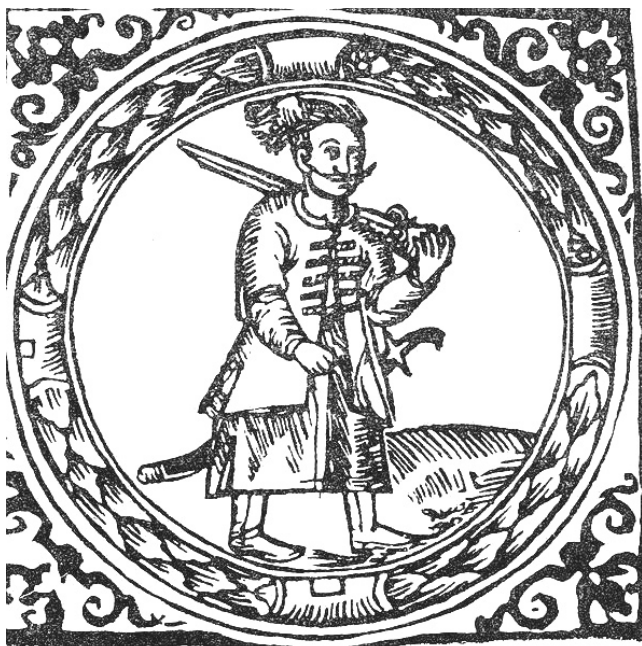
Герб Війська Запорозького

З 15 по 17 червня 1621 р. в урочищі Суха Діброва відбувалася козацька рада, на якій вирішувалося питання про участь у поході проти турецької армії. На ній був присутній київський митрополит Йов Борецький, королівський посол Бартоломей Обалковський і ксьондз Оборницький. Митрополит виступив на раді з великою промовою, охарактеризувавши становище православ'я в Україні, від чого, за словами сучасника «гнівом сповнилися козацькі серця». Після цього Петро Сагайдачний зачитав грамоту патріарха Феофана. Наявність багатотисячного козацького війська змусила ксьондза Оборницького відзначити в своєму щоденнику: «Потрібно побоюватися, як би справа не дійшла до повстання, до селянської війни. Дуже вони тут розхвилювалися і все більше зростає їх свавілля, коли побачили вони себе в такій чисельності і силі» 78 . На раді козаки згодилися