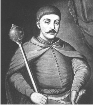
Іван Брюховецький (1623-1668)

та Правобережну. В умовах жорсткого суперництва до владив Чигирині прийшов досвідчений і авторитетний серед козацької старшини Павло Тетеря. Перші його кроки засвідчили про намір консолідації сил для зміцнення єдиної держави через порозуміння з наказним гетьманом Якимом Сомком та кошовим отаманом Іваном Брюховецьким. Повноважні посольства були направлені до турецького султана, молдавського володаря та короля Речі Посполитої. Зокрема, останнє мало домагатися збереження вольностей Війська Запорозького та здійснення походу на Лівобережжя з метою його приєднання до Правобережної України 225 . Водночас Павло Тетеря фактично відмовився від політичної автономії Гетьманщини і дозволив повертатися до своїх маєтків польській шляхті та колишнім урядникам.