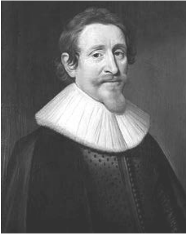
Гуго Гроцій (1583-1645)

Близькою до цього ряду вчень була модернізована теорія природного права нідерландського правника Гуго Гроція (1583-1645). У праці «Три книги про право війни і миру» (1625) пропонувалася нова доктрина, яка містила оригінальні вирішення проблем загальної теорії держави та права. Автор стверджував, що саме суспільний розвиток і здатність людей керуватися розумом змусили їх добровільно укласти угоду про створення держави 30 . Концепція