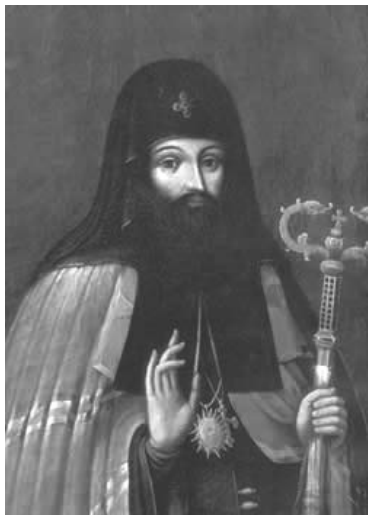
Петро Могила (1596-1647)

Чимало зусиль для відтворення пам'яті про княжі часи і, зокрема, піднесення культу святого Володимира, доклав київський митрополит Петро Могила. Відповідаючи на закиди православним з боку Касіяна Саковича, він обстоював тезу, що сучасна їм Україна є спадкоємницею Київської Русі, а «народ руський» має власну історію, мову та церкву 46 . На дум-