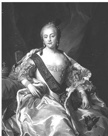
Єлизавета Петрівна (1709-1761)

Плани Кирила Розумовського були не до вподоби