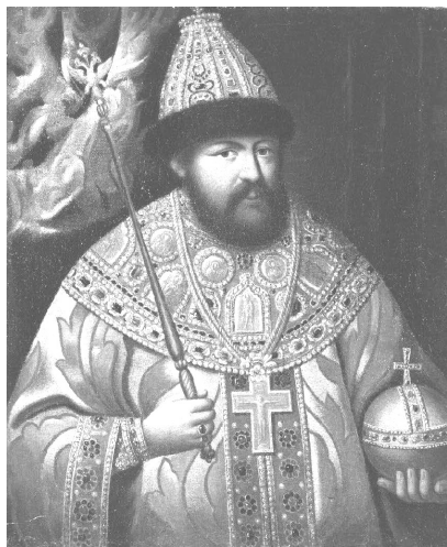
Олексій Михайлович (1629-1676)

Загальний характер формулювань українсько-московської угоди зумовив появу різноманітних трактувань її змісту у