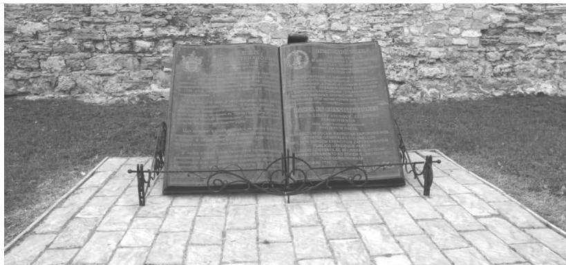
Пам'ятний знак «Конституція Пилипа Орлика»

переглянути політичний устрій в Україні. Найближчі соратники гетьмана, насамперед молодша генерація козацької старшини, здебільшого, вихованці Києво-Могилянської академії – Григорій Герцик, Пилип Орлик, Федір Нахимовський, Василь Ломиковський, Федір Мирович були прихильниками нових ідей європейського політикуму, які декларували ідеологи ранньобуржуазних революцій, зокрема, ідеї про створення держави внаслідок договору між правителем та підданими. Взірцевою формою державного життя вбачалася конституційна монархія. Переваги останньої наочно постали перед творцями «Пактів і Конституції законів і вольностей Запорозького війська» в умовах еміграції навесні 1710 р. Цей документ відомий широкому загалу як «Конституція Пилипа Орлика».