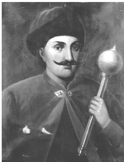
Іван Виховський (1608-1664)

князівського титулу і запровадження спадкового гетьманства 204 . Невдала спроба його реалізації через укладання династичного шлюбу не змінила політичних планів українського гетьмана. Запровадження монархічної форми правління мало б убезпечувати володаря булави від козацької охлократичної стихії і відкривало б можливості для утвердження міжнародної легітимації Війська Запорозького. Україна, аналогічно невеликим державам – Волощині, Молдавії, Трансільванії, не маючи можливості відстояти свою самостійність, змушена була шукати могутніших володарів-сюзеренів 205 . Це підкреслювалося в заяві Богдана Хмельницького у 1649 р. «... я буду триматися того пана, який мене ласкаво з Божої ласки держить в своїй опіці» 206 . Проте монархічна ідея не мала серйозної підтримки в тогочасному