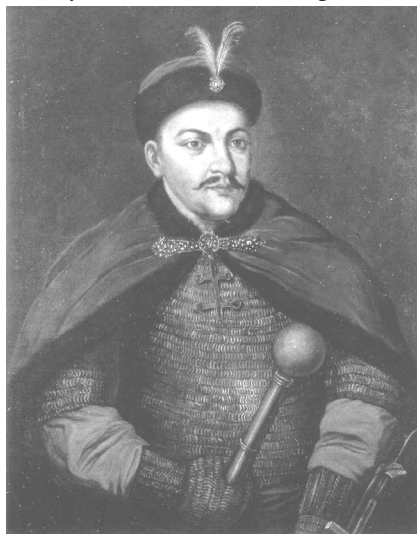
Юрій Хмельницький (1641-1685)

Козацька старшина спробувала виправити прорахунки Івана Виговського при підготовці проекту договору з Московським царством після обрання гетьманом Юрія Хмельницького. Незважаючи на потенційний громадянський конфлікт, зростаючу соціальну напругу і охлократичні настрої серед козацтва, на раді у Жердовій Долині були сформульовані нові положення, які передбачали самостійність України при формальній протекції московського царя. Зокрема, до Війська Запорозького мали ввійти землі Північної Чернігівщини та частини Білорусії, передбачалося заборонити перебувати у містах московським військам та воєводам, крім Києва, планувалося вільно обирати гетьмана і мати право на ведення