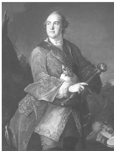
Кирило Розумовський (1728-1803)

вищим імперським чиновникам, які вбачали в ньому серйозного конкурента впливу на Єлизавету Петрівну. Російський канцлер Олексій Бестужев-Рюмін, водночас і Президент колегії закордонних справ, у віданні якого перебувала Україна, здійснив ряд кроків у напрямку ліквідації її автономного устрою. Зважаючи на тривалу відсутність Кирила Розумовського у глухівській резиденції, він постійно направляв туди російських радників для кореляції урядової політики. З 1754 р. гетьману