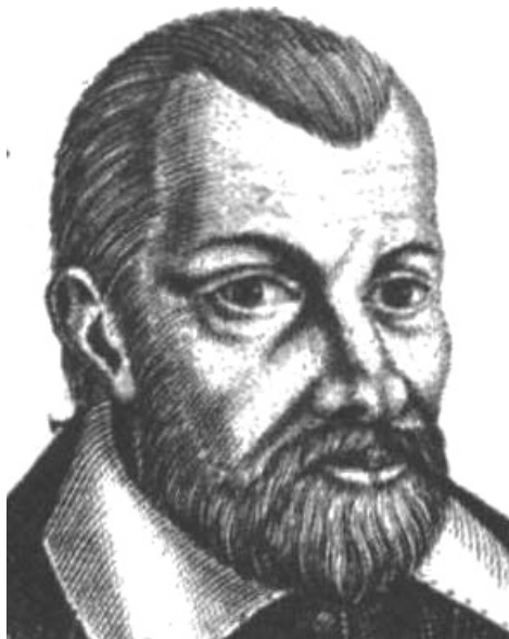
Жан Боден (1530-1596)

Теорія божественного права короля стала безпосередньою реакцією на існування вчення про обмеження монаршої влади і викристалізувалася у лихоліттях громадянських воєн та розвивалася з посиленням французької корони наприкінці XVI ст. По суті це вчення стало модифікацією давньої ідеї про божественне походження влади. У народній інтерпретації воно набуло своєрідного змісту, об'єднуючи під цим політичним гаслом представників різних соціальних верств та християнських конфесій. Божественна легітимність, приписувана королівській владі, базувалася виключно на релігійних почуттях віруючих.