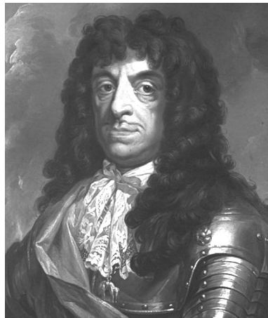
Ян Казимир (1609-1672)