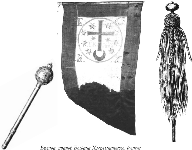
Булава, прапор Богдана Хмельницького, бунчук

вождя і володарі сусідніх держав. Відповідно найприйнятнішою для Хмельницького стала ідея створення в Україні монархічної форми правління, яка б відповідала тенденціям організації ранньомодерного політичного простору. Адже і в попередній період спостерігалися симпатії козаків до сильної королівської влади. Зокрема, великі надії запорожці покладали на Владислава IV. Успіх на перших етапах повстання завдячувався і деклараціями в універсалах Хмельницького про те, що козаки виступили не проти короля, а проти українських та польських урядовців, які чинили утиски 159 . Популярною також була теза, що козаки повстали з дозволу Владислава IV для захисту монарха перед магнатським свавіллям 160 .