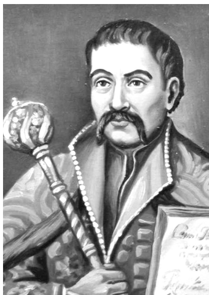
Пилип Орлик (1672-1742)

Федора Протасьєва супроводжувалася розширенням його повноважень. В інструкції канцлера Гаврила Головкина було положення про необхідність повідомляти про доноси на гетьмана та старшину, а для допиту їх відсилати до російських воевод. Згодом цей пункт був деталізований стосовно методів пошуків людей, на яких будуть надходити скарги, за участі російських «ратних людей». Звіти про свою діяльність резидент надсилав до Петербурга регулярно раз на два місяці. Його робота була