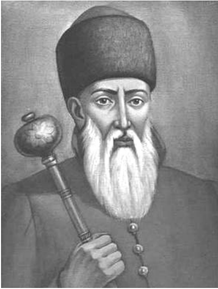
Петро Сагайдачний (1582-1622)

навіть не згадувалося. Тому й не випадково, що козаки не зважали на рішення сейму і навесні 1615 р. козацькі чайки підійшли до Стамбула 75 . Морські експедиції, очолювані Петром Сагайдачним, викликали занепокоєння при султанському дворі, а також впливали на зростання козацьких рядів. У королівській інструкції від 20 січня 1616 р. наводиться загальна чисельність козаків – до 40 тис. Тут же йшлося про продовження «козацького свавілля», яке