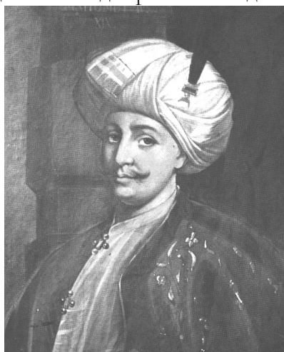
Мегмед IV (1642-1693)