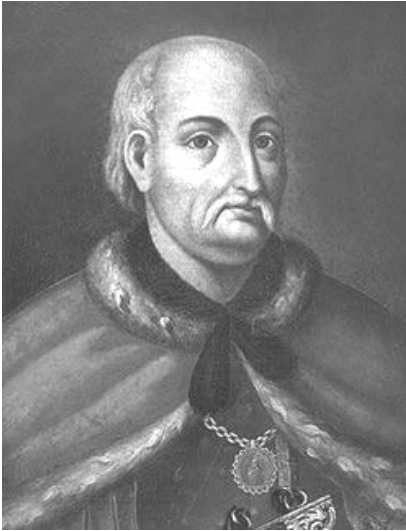
Іван Скоропадський (1646-1722)

Пилипа Орлика, про таку необхідність заявив у 1706 р. один із найближчих соратників царя Олександр Меншиков, а наступного року на військовій нараді в Жовкві сам Петро I 250 . Реформи передбачали перетворення козацького війська в регулярні підрозділи російської армії, а виборну старшинську адміністрацію планувалося замінити воєводською або ж губернаторською.