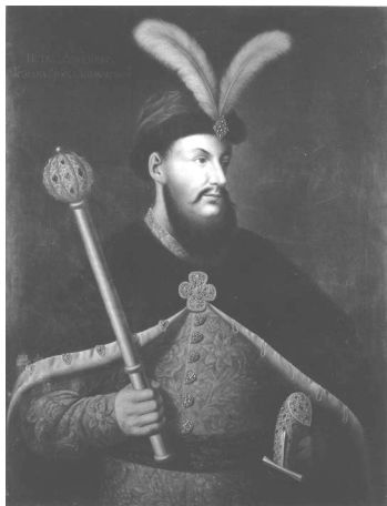
Петро Дорошенко (1627-1698)

кампанії зумовлювався не лише силою противника, але й міжусобицями серед правобережних старшин та втручанням у політичне життя Гетьманщини Запорозжя. У вирі збройного конфлікту загинули Іван Виговський, Іван Богун, а Григорій Гуляницький, Юрій Хмельницький та київський митрополит Йосип Нелюбович-Тукальський були захоплені в полон і вислані до Мальборської фортеці 227 . Згодом і Павло Тетеря, опинившись у безвиході, залишив Чигирин і втік до Польщі.