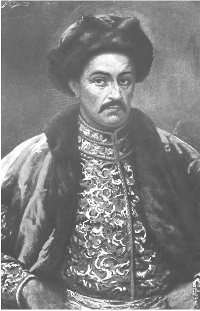
Іван Мазепа (1639-1709)

відбулося у московському Успенському соборі. Дозвіл на перепідпорядкування митрополії потрібно було узгоджувати з усіма православними патріархами. Проте московські урядовці підкупили турецьку владу. Вона вплинула на константинопольського патріарха Діонісія, який одноосібно вирішив це питання. Таким чином, у 1686 р. київська митрополія була підпорядкована московському патріархату 247 . Відтепер українська православна церква використовувалася як зняряддя колонізаційної політики царської Росії, що