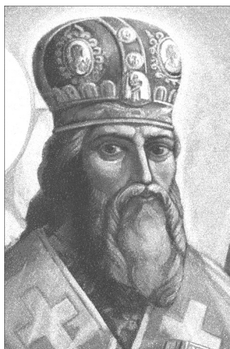
Йов Борецький (р.н. невід.-1631)

Одним з найважливіших питань полемічної літератури в процесі дискусії з опонентами стало звернення до історії хрещення Русі, в якій автори вбачали першооснову, «св'яту старовину». Визнаючи поетапність процесу запровадження християнського віровчення, вони стверджували, що власне Володимирове хрещення означало його завершення. Знаменним чинником, на думку Захарії Копистенського, стало прийняття християнства не від «старого латинського Риму», а від «нового грецького», тобто Константинополя. У контексті історико-генетичного зв'язку з киево-руським минулим, що сприяло піднесенню церковного пошанування Володимира Великого,