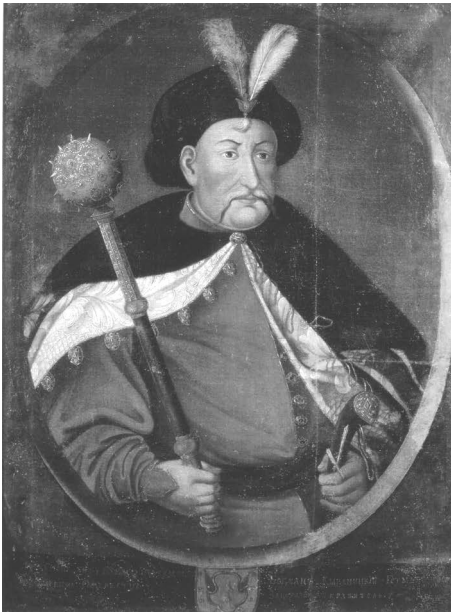
Богдан Хмельницький (1595-1647)

березні 1648 р. Миколаєм Хмелецьким та Станіславом Кричевським, містилися кілька чітких пунктів. Насамперед, це стосувалося поновлення козацьких прав і привілеїв, обмежених «Ординацією», збільшення реєстру та виведення кوارцяного війська із України 128 . У листі до короля Владислава IV від 31 березня коронний гетьман зазначав, що козаки прагнуть «абсолютно панувати в