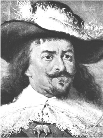
Владислав IV (1595-1648)

і постановили, щоб наш руський народ не терпів більше таких утисків» 60 . Цей прецедент засвідчив про зростання політичної свідомості козацтва і його наміри утвердити свої права в суспільно-політичному житті України.