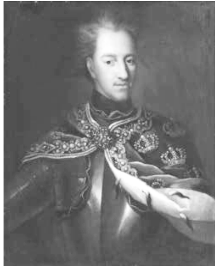
Карл XII (1682-1718)

Характер політичної влади в Україні зазнав суттєвих змін також внаслідок «Московських статей» 1689 р., які були підписані в той час, коли