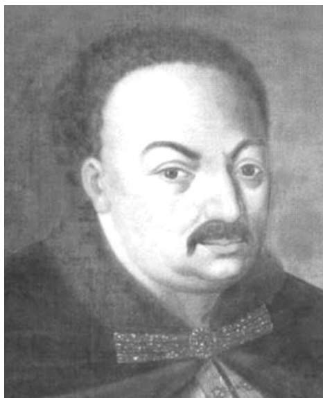
Іван Самойлович (1630-1690)

Влітку 1672 р. турецький султан Мегмед IV висунув ультиматум Речі Посполитій про відмову від Правобережжя. Згодом розпочалася інтервенція османів на територію Поділля, під час якої Петро Дорошенко приєднався до війська Оттоманської Порти. Їхні успішні дії змусили Михайла Вишневецького піти на переговори. У тексті польсько-турецької Бучацької угоди 1672 р. обома сторонами визнавалося існування