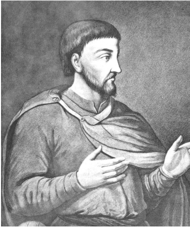
Дем'ян Ігнатович «Многогрішній» (1621-1701)

володар єдиної козацької держави. За розпорядженням П. Дорошенка під час церковних служб не повинно було згадуватися ім'я московського царя, а лише «благочестивого і Богом даного гетьмана Петра» 235 . Вірним соратником гетьмана у реалізації державної ідеї завжди був київський митрополит Йосип Нелюбович-Тукальський.