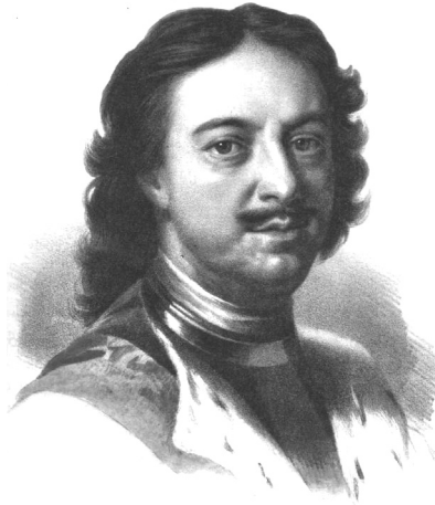
Петро I (1672-1725)

російський цар Петро I (1682-1725) потребував всебічної підтримки на шляху до самодержавного врядування. Тому Іван Мазепа вже знову визнавався повноправним володарем «гетьманом Війська Запорозького обох берегів Дніпра», про що засвідчувала спеціальна царська грамота. За гетьманом була визнана прерогатива на земельні пожалування козакам та міщанам. Головною опорою володаря булави стали охотниць-