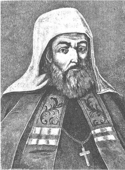
Гедгон Четвертинський (р.н. невід.- 1690)

стали своєрідним політичним компромісом між деморалізованою збройним конфліктом українською старшиною та виснаженим багаторічною війною з Річчю Посполитою урядом Московського царства. Останній навіть відмовився від прямого підпорядкування українських міст і сіл та збирання податків до царської скарбниці. Московським воєводам не дозволялося втручатися в українське судочинство, а земельні пожалування залишилися винятковою прерогативою