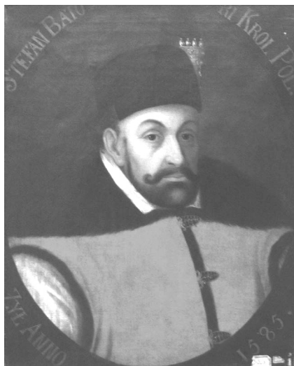
Стефан Баторій (1533-1586)