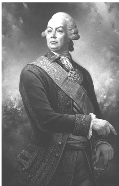
Петро Румянцев (1725-1796)

визнавала «сокровенную ненависть» українського народу до російського, яка особливо проявлялася серед козацької еліти. За таких умов генерал-губернатор повинен був здійснювати перетворення «не всегда силою вверенной вам власти, но более многообразными ласковости и снисхождения средствами действовать и оными, смотря по делу, по времени и по человеку, искусно изворачиваться должно. И для того можно сказать, что в таковых случаях надобно иметь и волчьи зубы и лисий хвост» 275 . Румянцеву належало постійно стежити за поведінкою старшин, особливо за підозрілими особами, щоб попередити можливі для імперії загрози. З метою зміцнення своєї влади та утвердження нових порядків генерал-губернатор мав також ефективно використовувати соціальні суперечності в українському суспільстві.