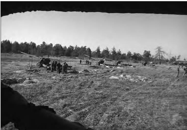
Злагодження розрахунків батареї на полігоні

Ну, это было немного, это так, кто-то там вылез случайно, человек 10-20 решило «прогуляться», выйти на наших. Пару снарядов пустили — они либо лягли там, либо отошли назад. А сильных было