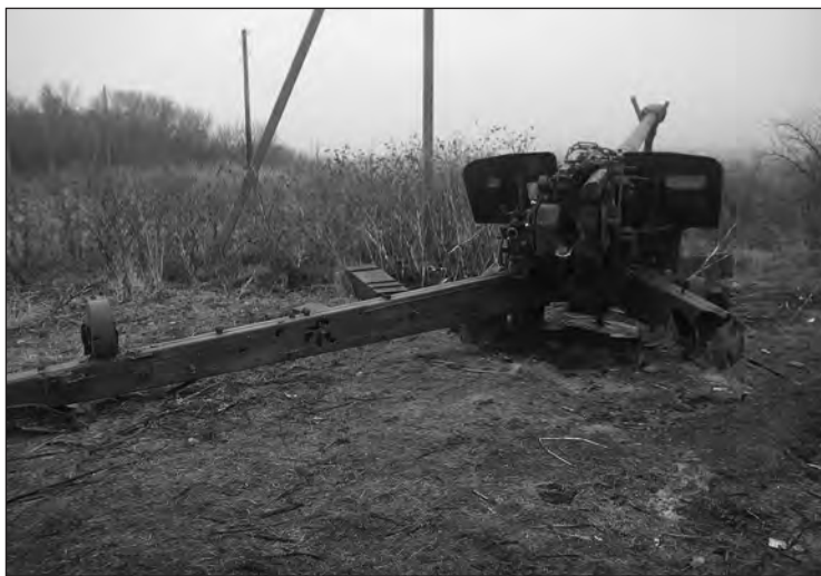
Пошкоджена внаслідок обстрілу гармата

Первый раз, когда нас «Градами» обстреляли, задело человека. Получается, он был в одном окопе, а рядом поставили миномет, он решил перейти туда. И в этот день, часов в одиннадцать или двенадцать начался обстрел «Градами», ему осколком задело ногу, ступню. Его вывезли.