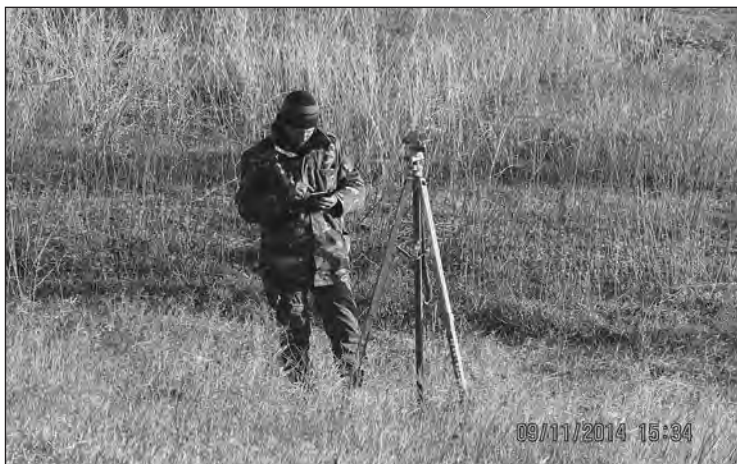
Робота з бусоллю ПАБ-2М

Старший офицер батареи, человек, который дает координаты, высчитывает. Комбат дает высоту, дирекционный угол и, по-моему, дистанцию, а СОБ переводит это в координаты, которые идут на орудие. Я, как командир орудия, даю уже посчитанные