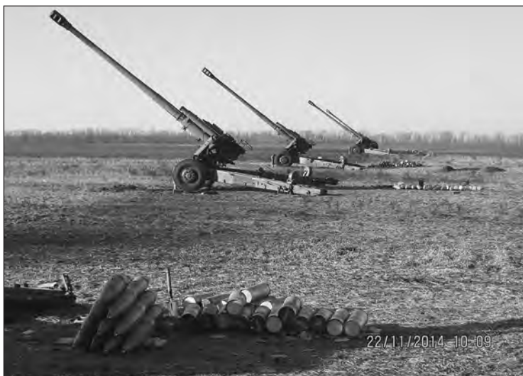
Батарея гаубиць 2А65 – однієї з найкращих артилерійських систем

ему тогда надо положить вот тут людей? Это один вопрос. Чем заходить дальше вглубь Украины – протестов станет больше, появятся тут партизаны, сопротивление будет еще больше, а чем дальше он будет идти на запад Украины – еще больше будет сопротивление. А что значит больше сопротивления – это большие потери, они ж не могут тут всю армию положить, чтоб забрать Украину. Ну это так, это мое мнение.