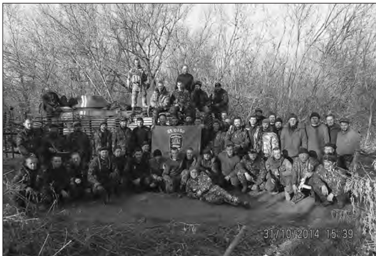
«Невидимки» на позиціях поблизу м. Волноваха Донецької обл.

Там, в общем-то, не было смысла людей держать, это стало больше символом, чем реальной точкой, где можно было укрепиться. Сейчас мы стоим на