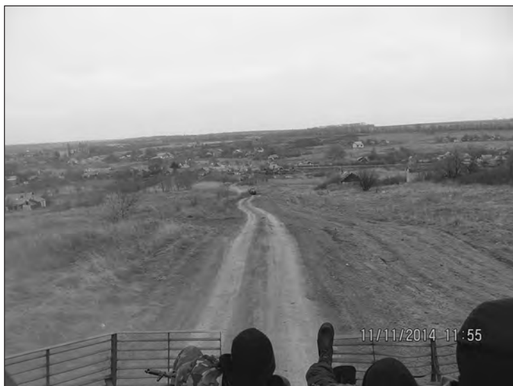
Переміщення на нове місце дислокації

и уезжаем. Вот так было один раз тоже, нас накрыли, сразу все по машинам. И отъехали. Чуть дальше, в сторону, ну, переждали пока ждешь, они постреляли. Переждали и вернулись, но в принципе, там немного зацепило, пушки, там две пушки. Щитки там побили, такое. Но. Один «Урал» там остался, колеса повыбивали, что-то еще, пока там оставался, и мы переехали на другое место и там на следующее утро нас опять накрыло. Уже где-то рядышком, метров двести, может, от нас, раз стрельнуло. Мы собрались и уехали. Там потом еще и артиллерия, слышно было, артиллерия работала, потом «Град». Побили там две пушки, хорошо пробили, колеса пробили. Ну, слава Богу, все живые, успели мы все быстро по