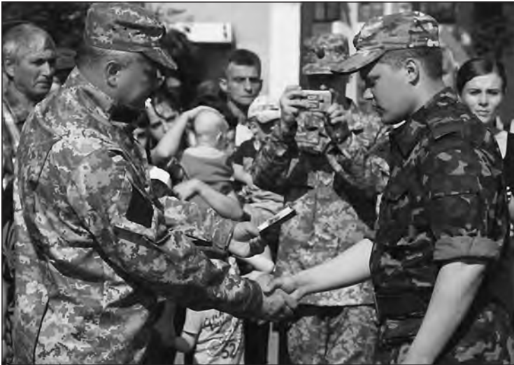
Нагородження бійців 55-ої оабр після виходу з Дякового