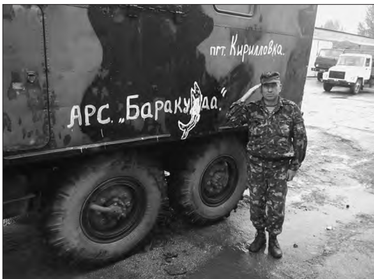
ЗІА-131 напередодні виїзду до Старобешевого