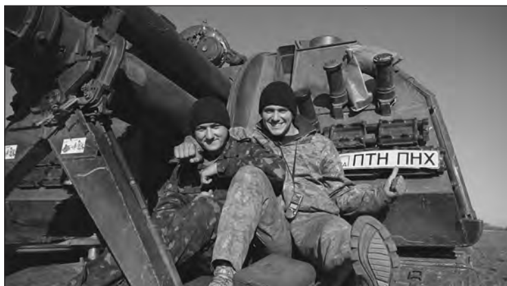
Бійці 55-ої оабр під час ротації до Волновахи

Да, головы даже поднять невозможно было.