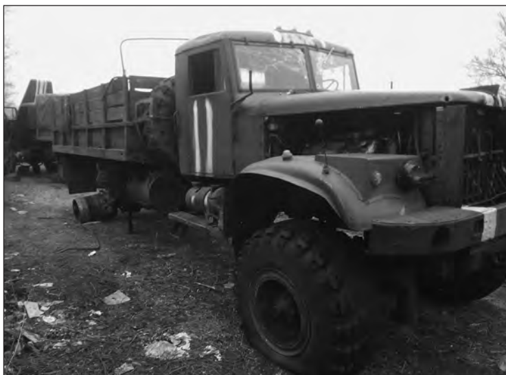
Автомобіль, розбитий внаслідок ворожого обстрілу

Першим зразу можу сказати, [що] були коректувальники, раз навіть бачили його, виїжджали на його місце, його розташування. Він недалеко від