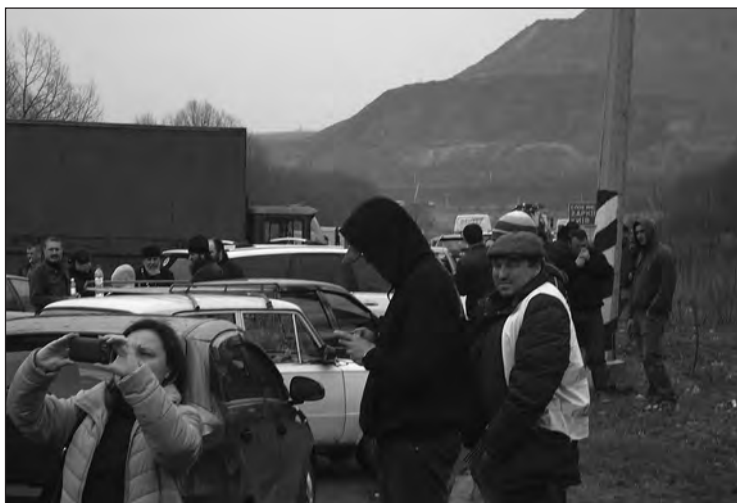
Спроби перешкодити рухові військових (Донецька обл.)

так тридцяти лет, так вот, если невооруженным глазом. Все они были кардинально настроены, чтобы мы дальше не ехали.