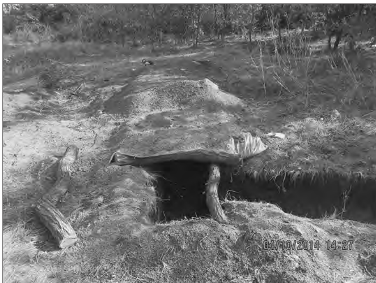
Бліндаж на позиціях

А под Волновахой какие задачи вам ставились?