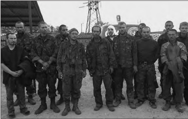
Звільнені з полону українські військовослужбовці (2014 р.).