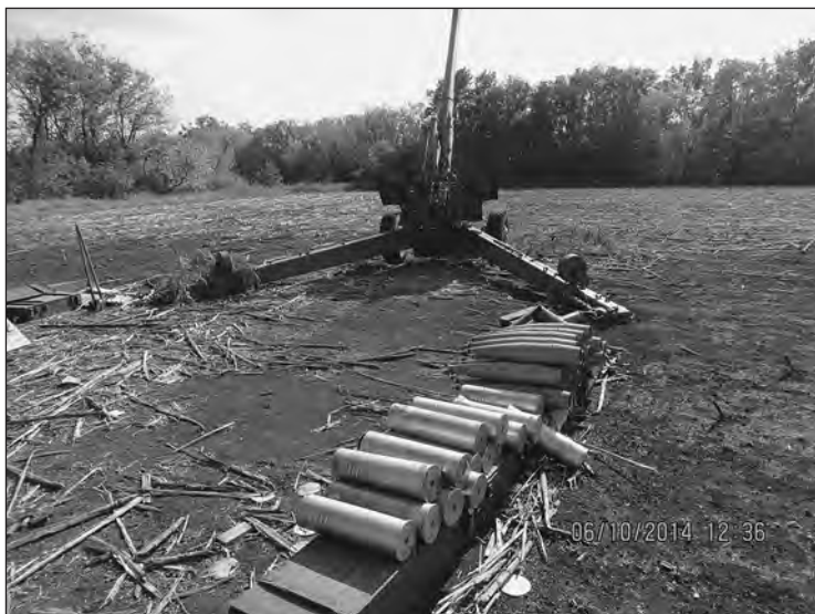
Гаубиця на бойових позиціях