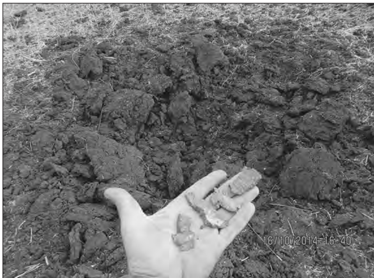
Воронка від вибуху та осколки ворожого снаряду