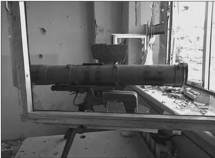
ПТУР на вогневій позиції в аеропорту