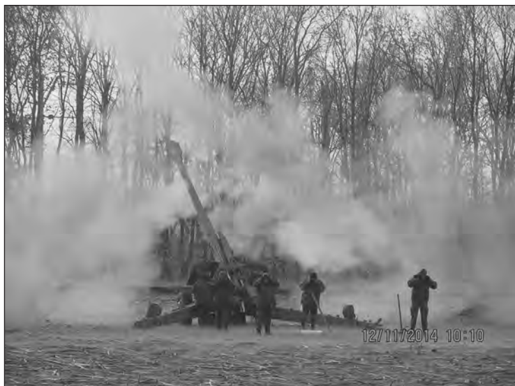
Гаубиця 2А65 під час пострілу

Ця артилерійська система є найновіша, яка є в Збройних силах України, досить точна, дальність ураження майже максимальна, яка є в збройних силах.