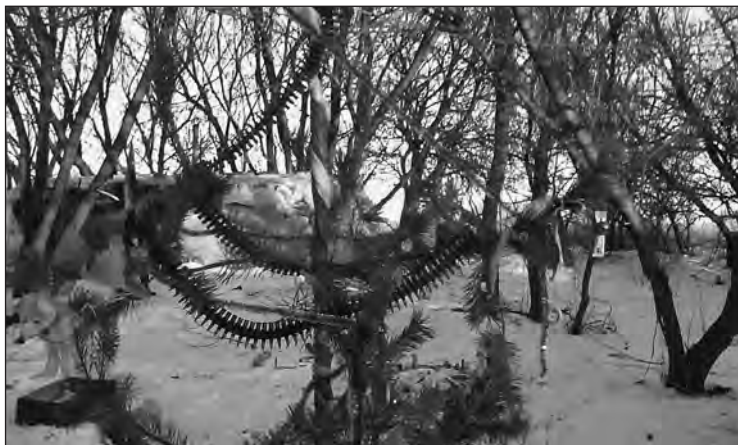
Новорічна ялинка артилеристів (31 грудня 2014 р.)

Из организаций это только «Сестры перемоги», они нам наиболее помогали. Тент для машины они нам прислали, термобелье, много всего. Они молодцы, стабильно. Вот перед отъездом сюда машина попала под обстрел, тент весь порванный, побитый. Они быстро откликаются, обещали заклеить. С одной из них моя жена познакомилась, когда мы приезжаем сюда, в часть, на ротацию. Они приезжают прямо сюда, с репортерами, они и фотки выставляли в интернет. И вот, моя жена с одной из них познакомилась, Катя, по-моему, зовут. Через нее я нашел свои фотки. Симпатично нас так встречают, как мы под рушником проходим, с