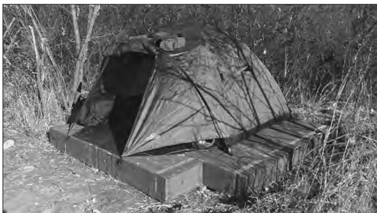
Намет на ящиках для снарядів

На виїзди надається сухий пайок на добу на кожну людину, а у базовому таборі видаються продукти, з яких ми самі собі готували їжу, починаючи від різних круп, буряка, картоплі, моркви, капусти, цукру, тушонки, згущенки і до хліба, хтось привозив, один із хлібзаводів, чи запорізький, чи який, я не пригадаю, надавав волонтерську допомогу, привозив свіжий хліб. Це було чудово: свіжий хліб і булочки. Я пригадую період, коли ми були під Вол-