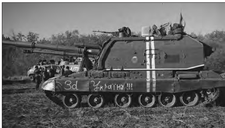
Самохідна артилерійська установка Збройних сил України

Украине поможет борьба с коррупцией. То есть люди сами увидят, что власть делает все для народа, а это еще больше поднимет дух людей, мы поймем, что не зря воюем. Почему многие у нас не идут в армию? Потому что они понимают, что у нас то ли сливают войска, то ли отдают их просто так под бой. Многие люди сомневаются в адекватности руководства, потому не хотят идти воевать. Я вот дома встречаю людей, спрашивают: «А что там происходит?» Говорю: «Ты же новости смотришь». Отвечает: «Там неправду показывают». У нас уже тоже показывают неправду, потому люди сомневаются, боятся. Мое мнение таково, что когда люди будут чувствовать, что власть о них заботится, тогда будет