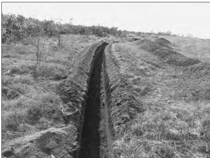
Окопи неподалік від м. Волноваха Донецької обл.