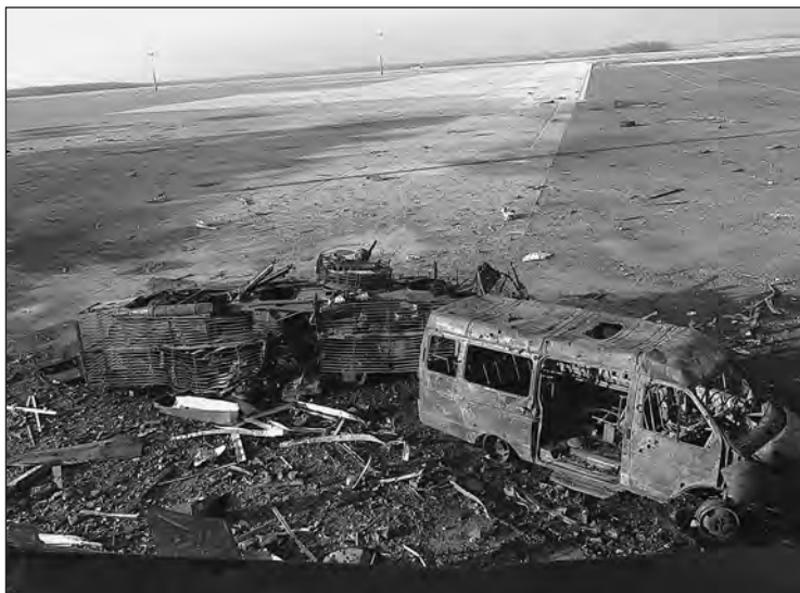
Розбита техніка у Донецькому аеропорту

Чесно, я не скажу скільки, я просто розкажу як це все було. Коли нас трохи проінструкували,