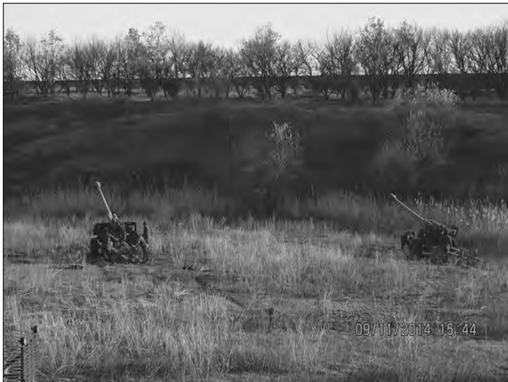
Позиції поблизу Донецька

Получается, третья, во второй раз, после Волновахи мы уехали десятого октября, мы уехали уже под Донецк, мы уехали. И там уже у нас палатки у всех были. Мы жили уже вместе с третьей батареей. Вот мы уехали и двадцатого числа, когда, не, мы приехали двадцать седьмого, двадцать шестого они, наверное, приехали. Поменяли третью бата-