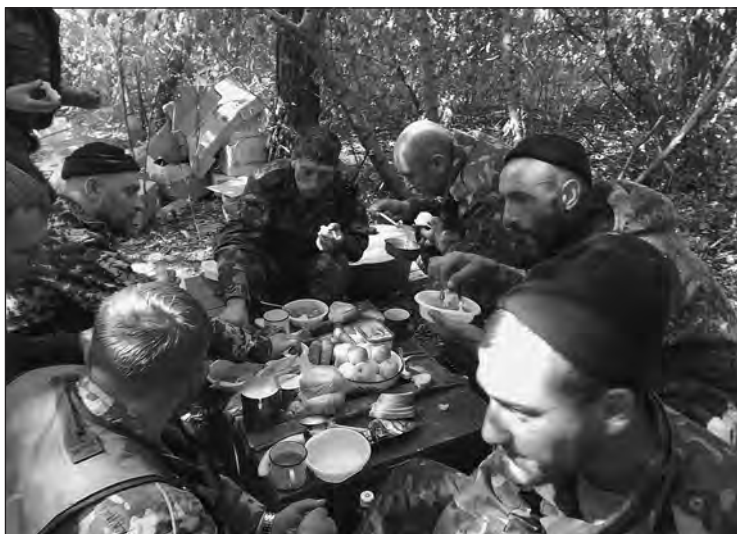
Обід у перерві між обстрілами

спал на орудийних ящиках, то есть отдыхали прямо в посадке. Попробуй выехать в посадку, за город, и попробовать сутки пробыть на тридцатиградусном морозе на улице. Ну, вот так. Я понимаю, конечно, что это война, деваться некуда, это не учения... Оно и палатки, с другой стороны, тоже, ставить палатки... Поставь палатку — в случае артобстрела палатку снимать уже никто не будет, потому что это человеческие жизни, палатка такой цены не имеет. Ну, вот так.