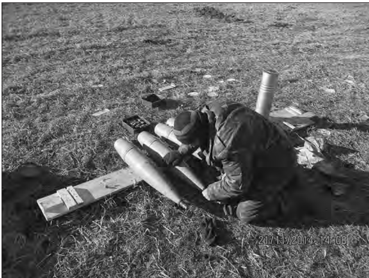
Підготовка снаряду до пострілу

Трубы 152 миллиметра, вес самого снаряда — около 48 килограмм, то есть если даже просто попасть не в укрепление противника, а просто где-то положить снаряд поблизости — его все равно достанет, даже если он зарылся в землю, это не имеет никакого значения. Потому такая мощь позволяет просто хоронить их в земле, скажем так.