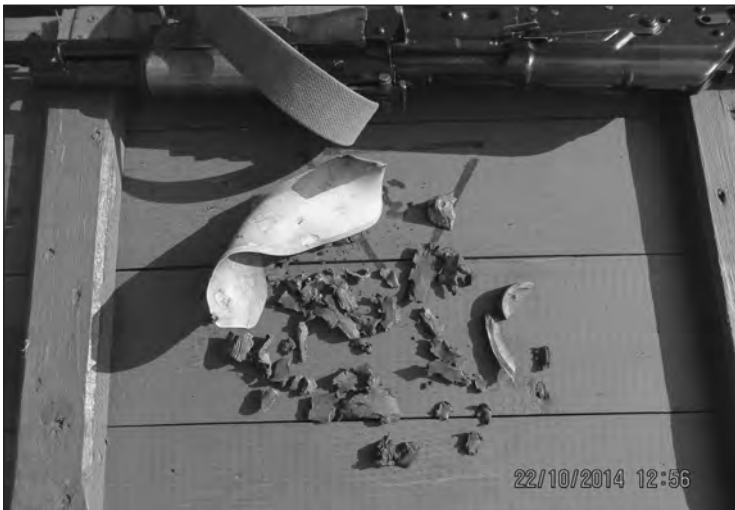
Осколки, зібрані після обстрілу

Потом как-то вроде оно сначала утихомирилось. Под вечер, часов так в девять, опять начался обстрел. До глубоких трех ночи нас обстреливали. Пришлось колонну даже бросить, бросить свои автомобили и уходить пешим ходом. Потому что уже били точно по машинам. Ну, Бог был к нам благосклонен, наша машина уцелела. Тент чуть-чуть осколками посеколо, нам повезло, нам просто повезло.