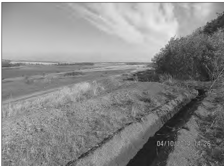
Окопи (Донецька обл., жовтень 2014 р.)

Нет, мы открывали огонь первыми, хорошо расставились, начали окапываться, может быть, не хватило окопов, я так думаю, потому, что окопы нужно копать чем глубже — тем лучше, если хочешь выжить — надо зарываться. Хоть как-то шанс есть для выживания, пусть небольшой, но