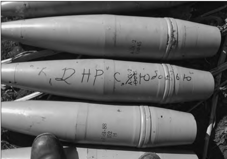
Снаряди для 152-мм гаубиці

Давай будем заканчивать, а то у меня уже время заканчивается. Надо готовить батарею к новому выезду.