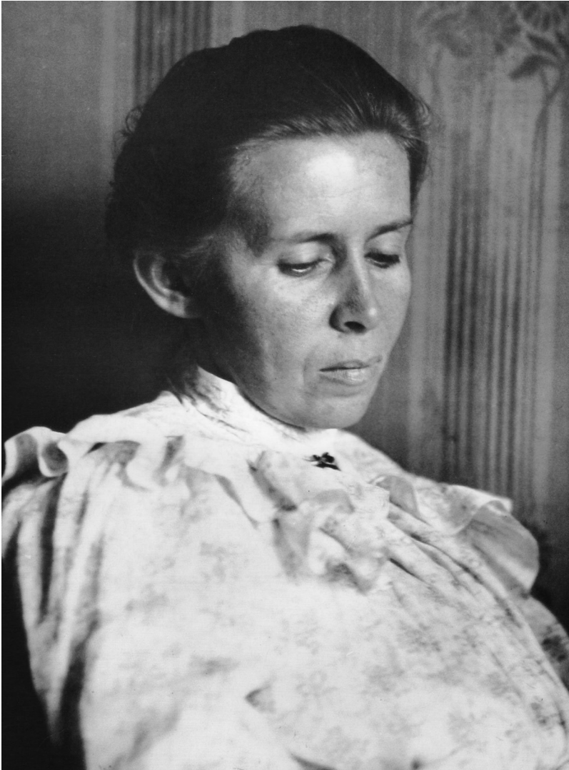
6. Одна з останніх світлин Лесі Українки. Київ, 6 травня 1913 р.