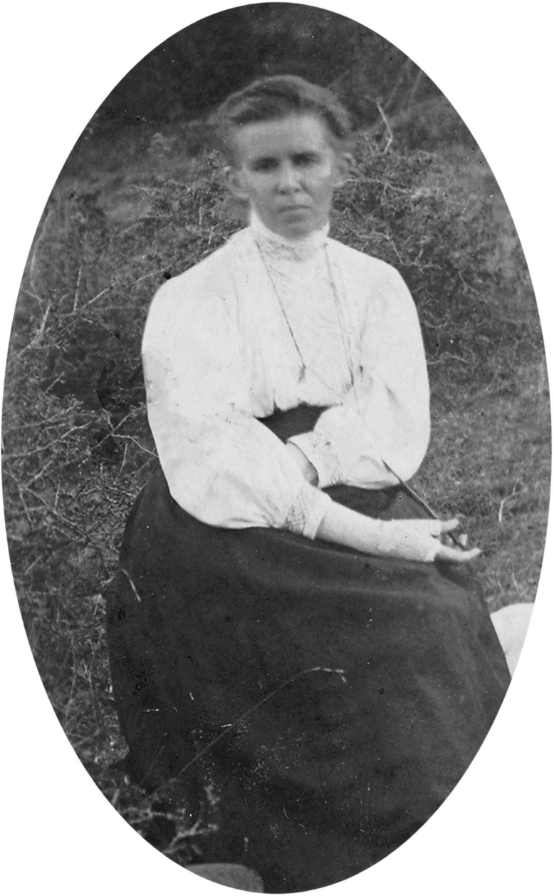
1. Лариса Косач-Квітка. Єгипет, 1912 р.